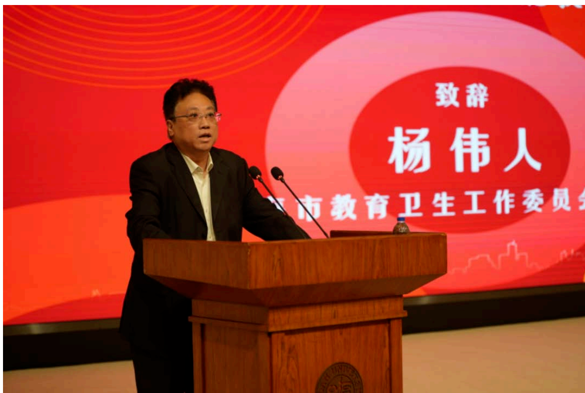
市教卫工作党委二级巡视员杨伟人致辞

5月26日，上海高校首届教学展示交流活动总结会在复旦大学举行。市教卫工作党委二级巡视员杨伟人、教育部高等教育司综合处负责同志等出席会议，本市39所本科高校及10余所外省市高校200余人现场参会，同时2000余人线上参会。