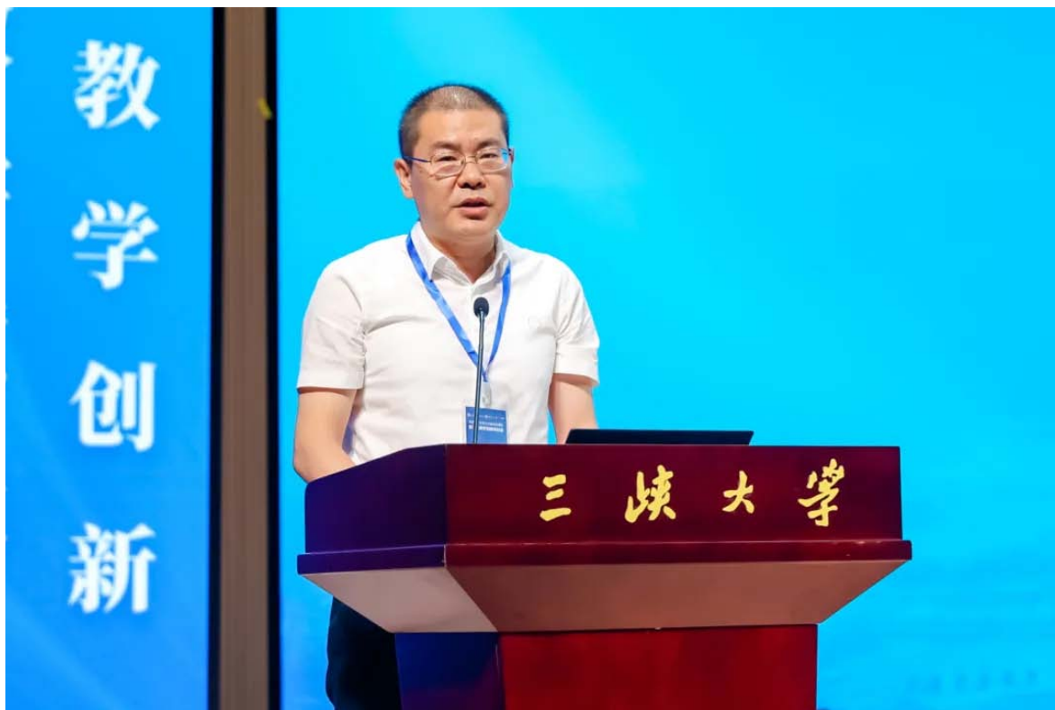
楚课联盟湖北大学副校长曾祥勇致辞