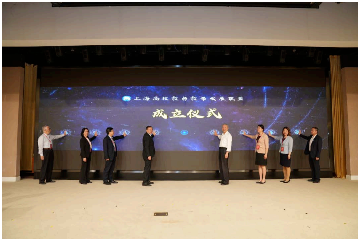
上海高校教师教学发展联盟成立

上海高校首届示范课堂展示交流活动由上海市教委主办，复旦大学承办，全市30所高校积极参与。各高校充分发挥示范课堂的引领作用，积极组织教学创新月活动，开展了形式多样的教学展示、研讨、论坛等互鉴交流活动。