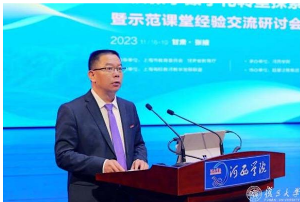
河西学院党委副书记、校长周勇致辞

布局数字化教育研究、推进教育数字化转型等工作。他表示，高校的数字化转型不仅是顺应时代发展的必然趋势，也是提升教学质量、创新科研模式、拓展社会服务能力的重要途径。河西学院将以本次研讨会为契机，学习借鉴各兄弟院校教学数字化转型和示范课堂建设的宝贵经验，加快学校教学数字化转型步伐，助推甘肃省高等教育数字化转型和高质量发展。