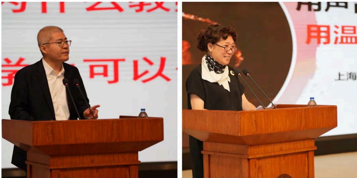
获奖教师交流发言

会上，总结展示了首届“上海高校示范性本科课堂建设”暨首届教学展示交流活动成果，为入选首批“上海高校示范性本科课堂”的课程和优秀组织奖高校颁发了证书。两位获奖教师进行了发言与教学展示。