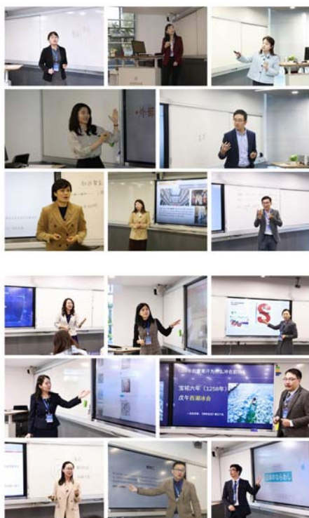
本次展示活动邀请了来自复旦大学、同济大学、华东师范大学、华东理工大学、东华大学、浙江工商大学及上海财经大学的资深专家担任评委，有多年从事教育教学管理工作的领导；有长期担任各类教学竞赛资深评委的专家；有在高校教师教学创新大赛国赛、全国高校混合式教学设计创新大赛、青年教师教学竞赛及各类教学专项赛事荣获优质奖项的专家。经过全天的竞赛展示，16位来自于三校的青教赛参赛教师都以优异的表现完成了展示，并从资深专家们的中肯评价与合理建议中收获良多。