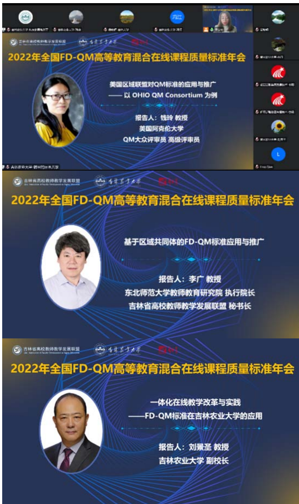
会议还设有六个分会场，围绕FD-QM标准在区域联盟和高校的应用与推广、FD-QM标准应用