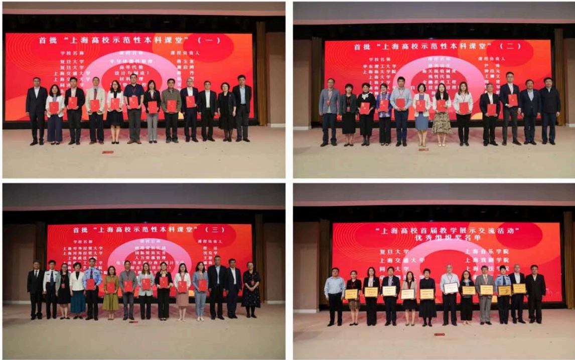
为首批“上海高校示范性本科课堂”和“上海高校首届教学展示交流活动”优秀组织奖颁奖

会上，总结展示了首届“上海高校示范性本科课堂建设”暨首届教学展示交流活动成果，为入选首批“上海高校示范性本科课堂”的课程和优秀组织奖高校颁发了证书。两位获奖教师进行了发言与教学展示。