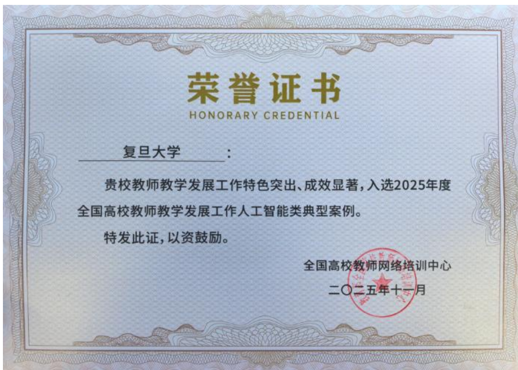
2025 年度全国高校教师教学发展工作人工智能类典型案例