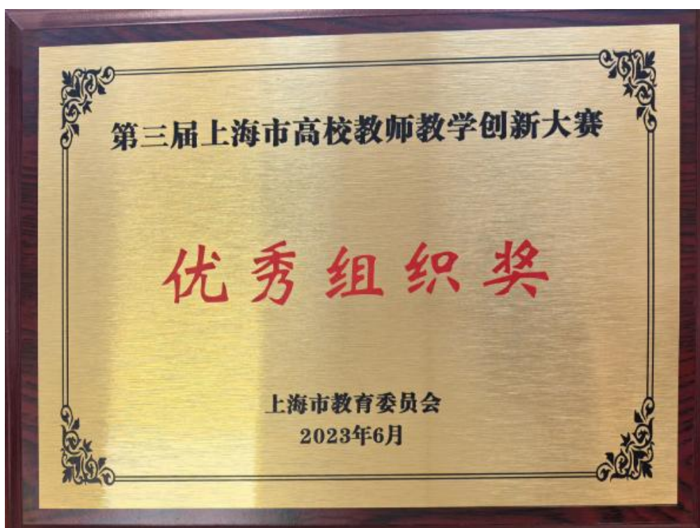
第 3 届上海市高校教师教学创新大赛优秀组织奖