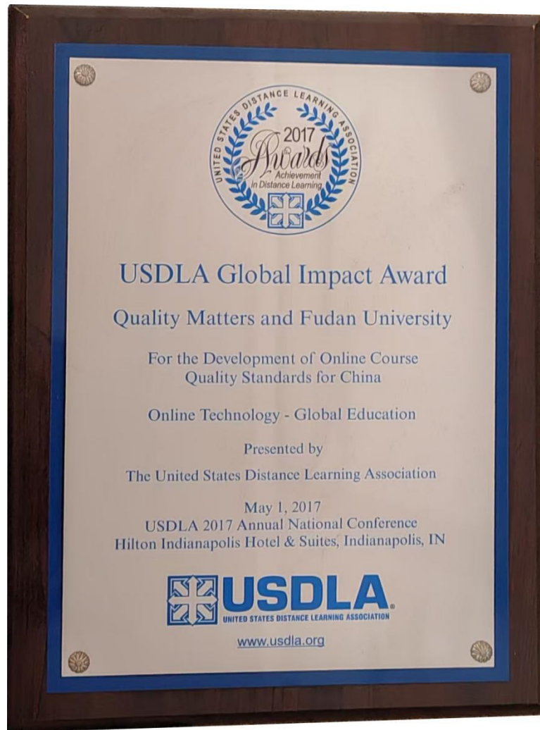
全球影响力奖 (FD-QM 在线课程质量标准开发)