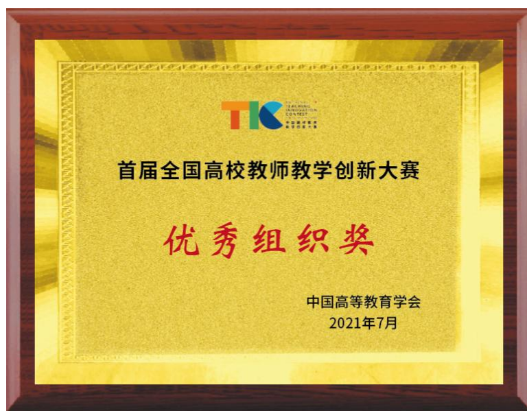
首届全国高校教师教学创新大赛优秀组织奖（复旦大学）