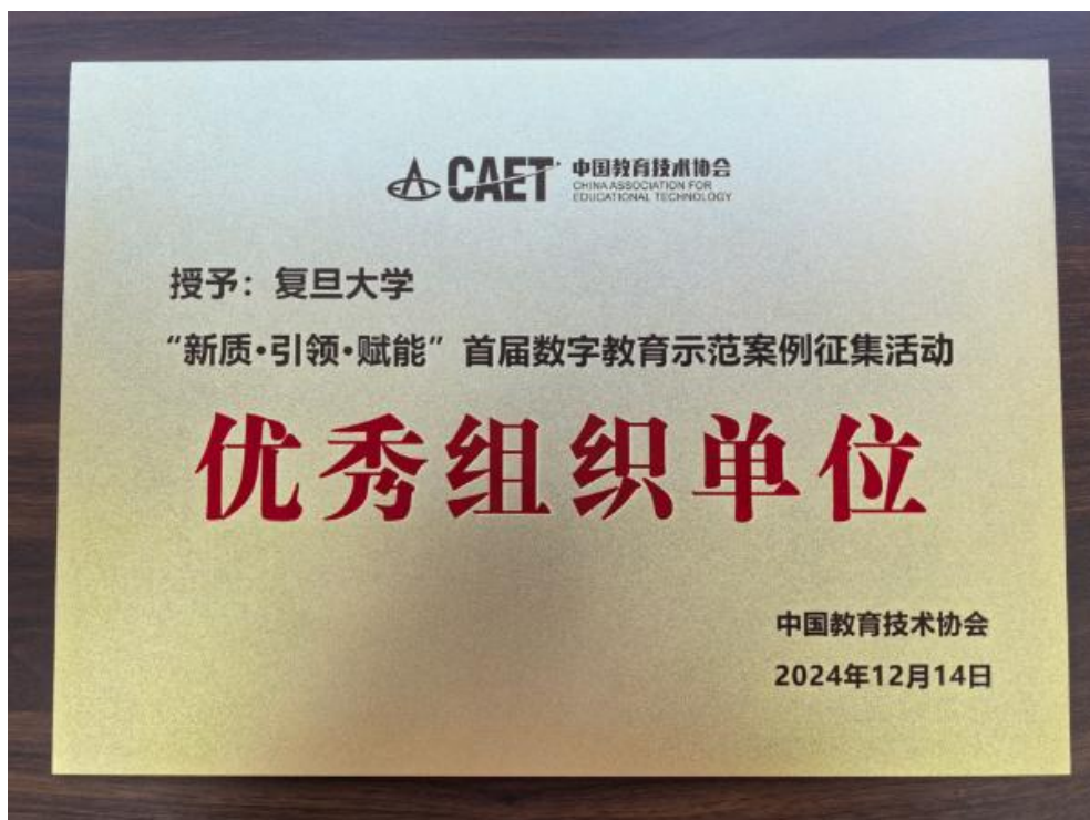
首届数字教育示范案例征集活动“优秀组织单位”称号