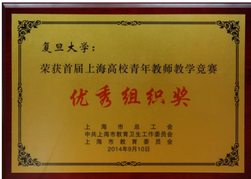
第1届上海高校青年教师教学竞赛优秀组织奖