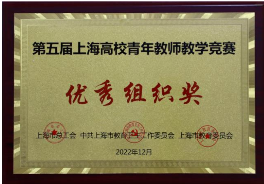
第5届上海高校青年教师教学竞赛优秀组织奖