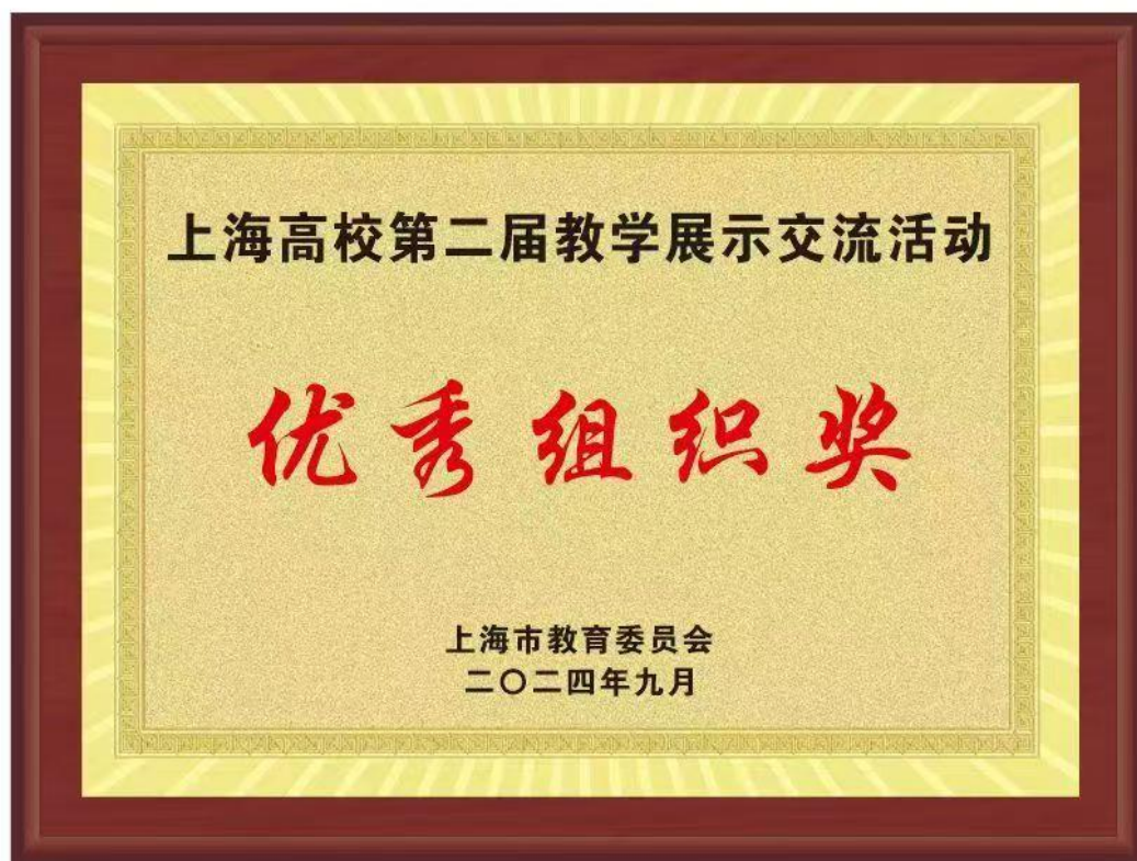
上海高校第二届教学展示交流活动优秀组织奖