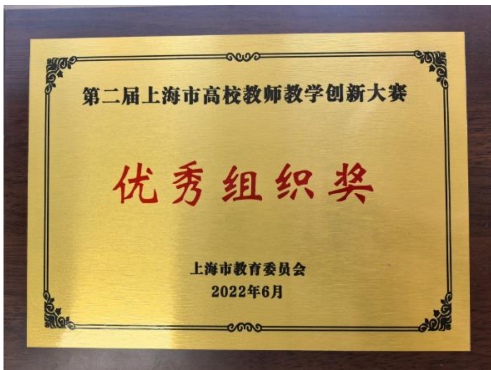
第 2 届上海市高校教师教学创新大赛优秀组织奖