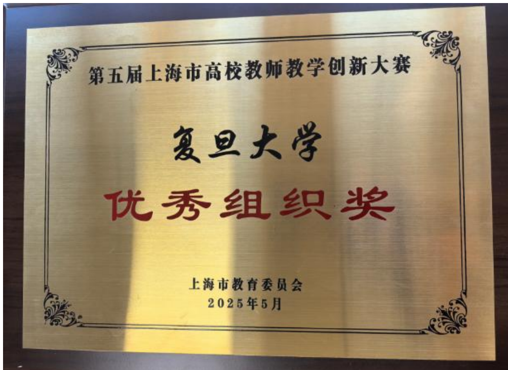
第5届上海市高校教师教学创新大赛优秀组织奖