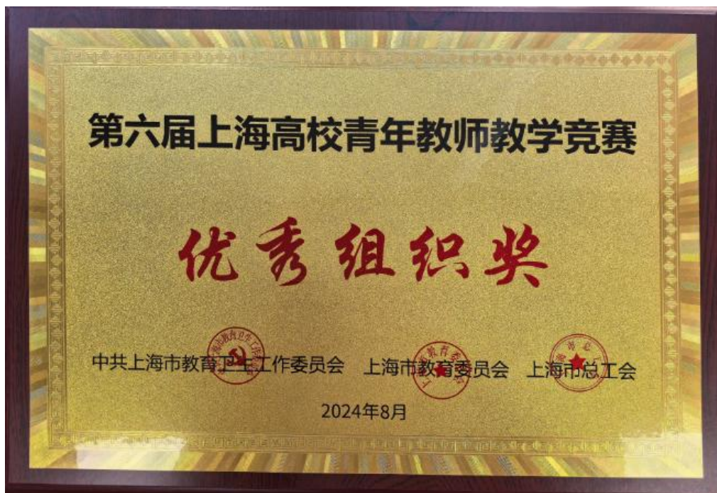
第6届上海高校青年教师教学竞赛优秀组织奖