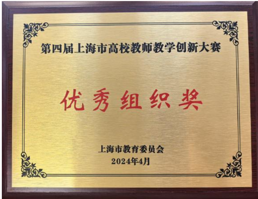
第4届上海市高校教师教学创新大赛优秀组织奖