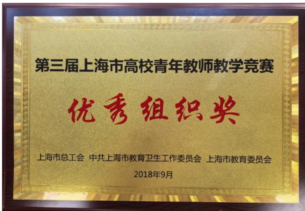
第 3 届上海高校青年教师教学竞赛优秀组织奖