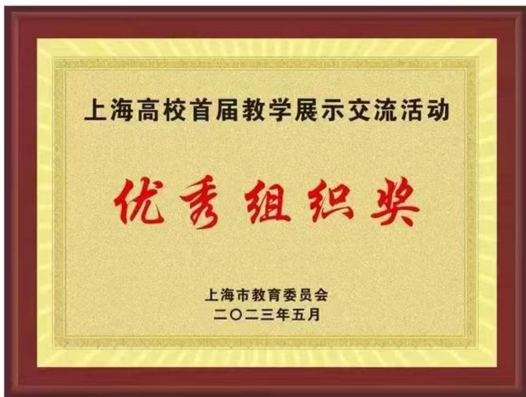
上海高校首届教学展示交流活动优秀组织奖