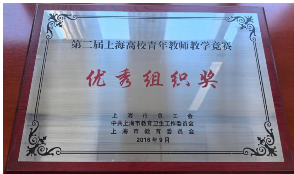
第2届上海高校青年教师教学竞赛优秀组织奖