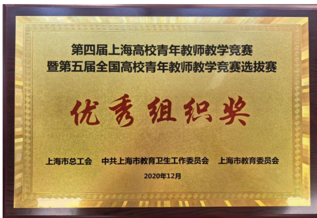
第 4 届上海高校青年教师教学竞赛优秀组织奖