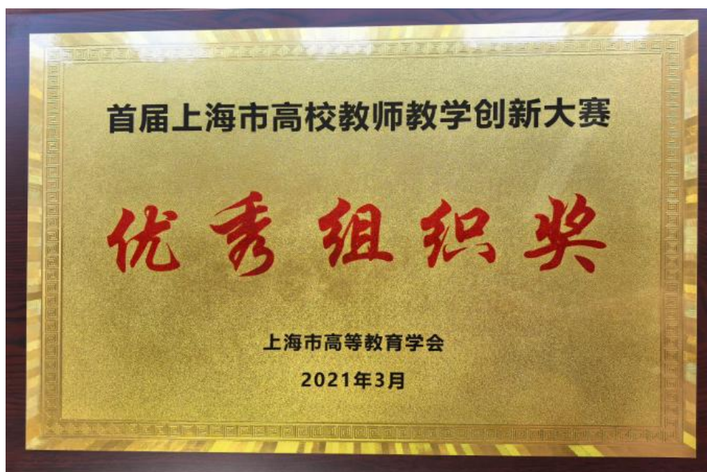
第1届上海市高校教师教学创新大赛优秀组织奖